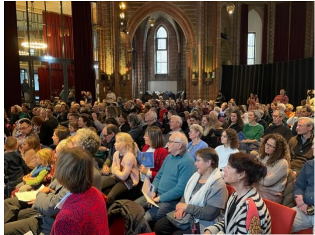
Publiek in de Vondelkerk

In 2022 zijn we ook weer begonnen met het organiseren van concerten in het Atrium. Kleinschalige en onversterkte concerten blijken prima georganiseerd te kunnen worden zonder dat we hiermee overlast veroorzaken aan de buurtbewoners.